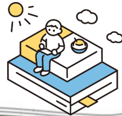
中央図書館カレンダー 8月

どちらも展示期間は8月25日（日）までとなっております。 この機会にぜひご覧ください。