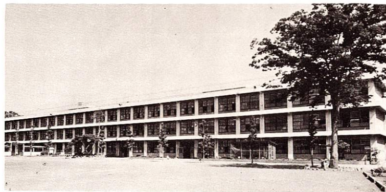
福生市立第一小学校