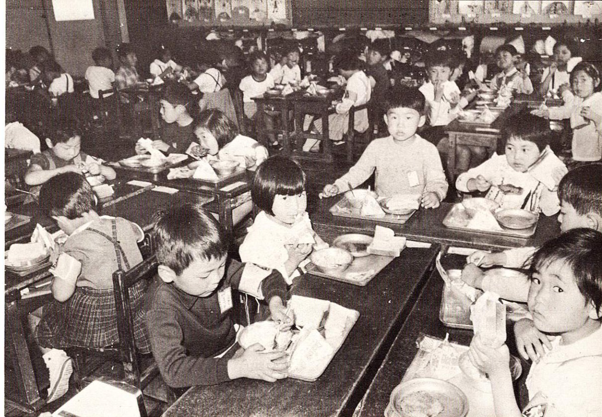
楽しい学校給食のひとつとき