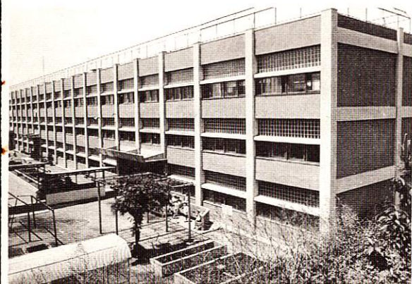
福生市立第三小学校