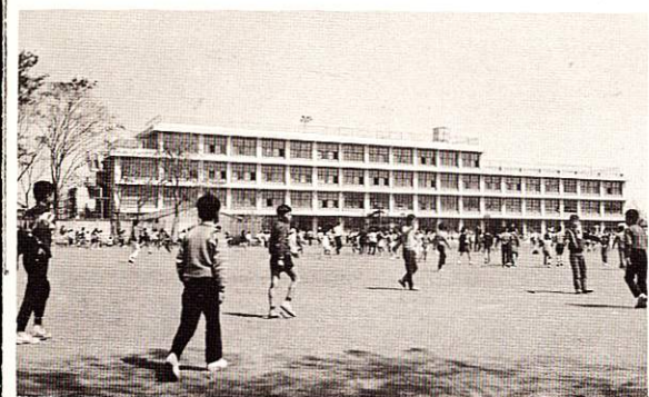
福生市立第二小学校