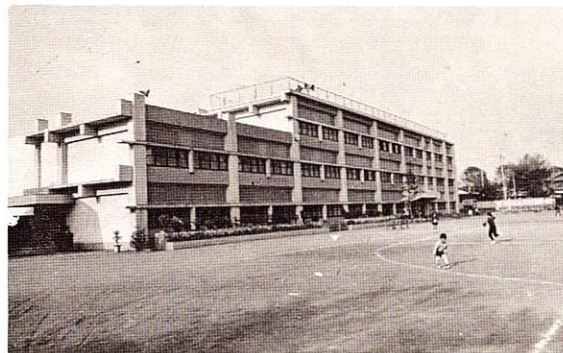
福生市立第四小学校

今年で田植をする児童の姿は見られなくなる。 都市化の一端がこんなところにもものぞかれる。