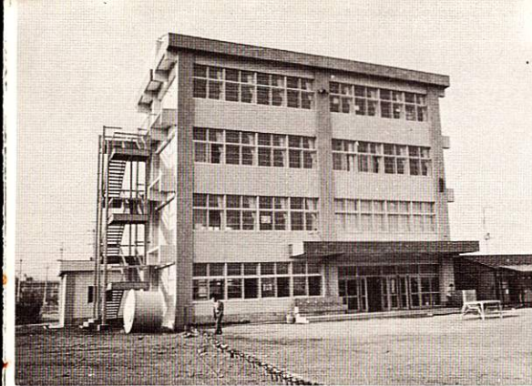
福生市立第一小学校分校