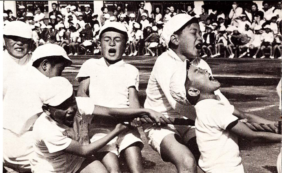
秋空のもとよい子たちの顔、顔