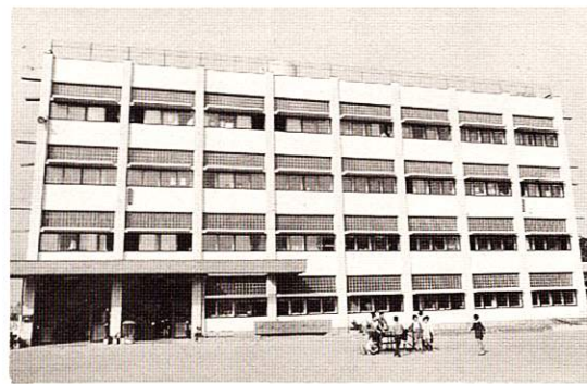
福生市立第五小学校