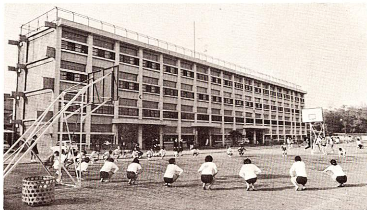
福生市立第二中学校