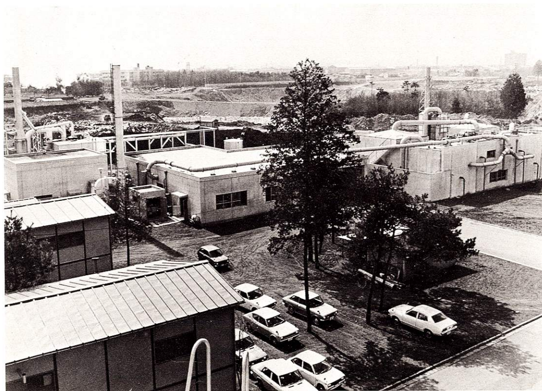
新しく造られたし尿処理場(西多摩衛生組合)