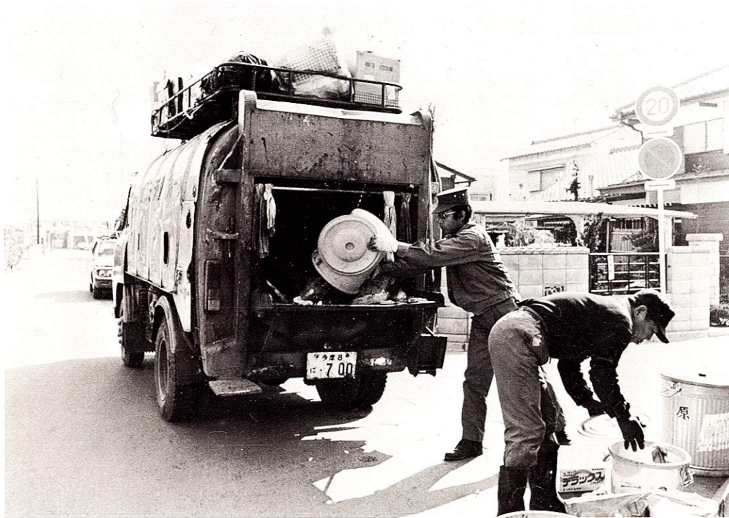
燃えるゴミ、燃えないゴミは分けて収集