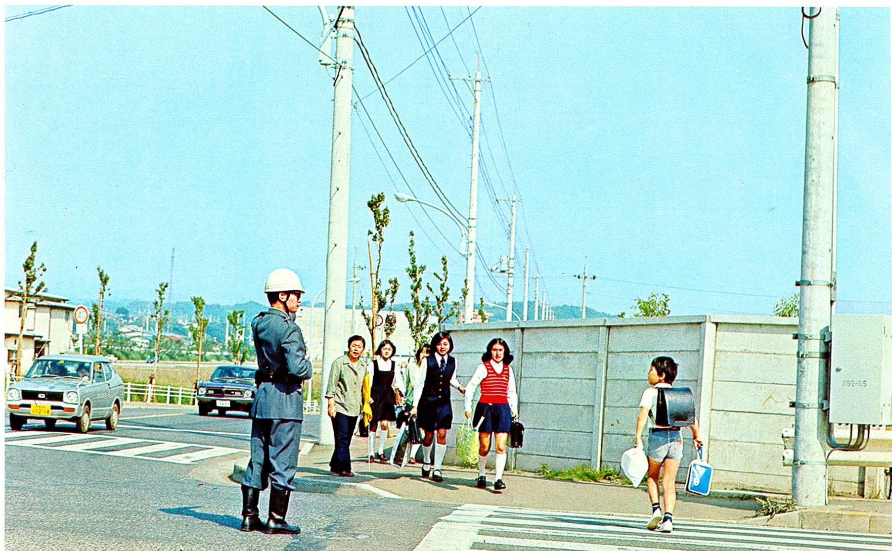
市民を交通事故から守るため、街頭に立つ警察官

市は、市民を犯罪や災害から生命と財産を守るため、これらの諸機関と相互に連絡を取り合いながら、各種の施設の整備や拡充に積極的に取り組んでいます。