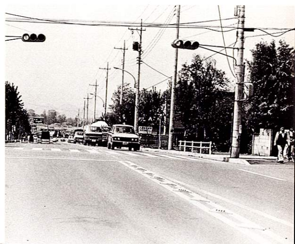
整備が完了した道路