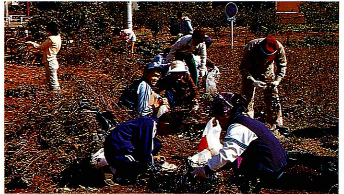
観光農園では待ちに待った落花生の収穫