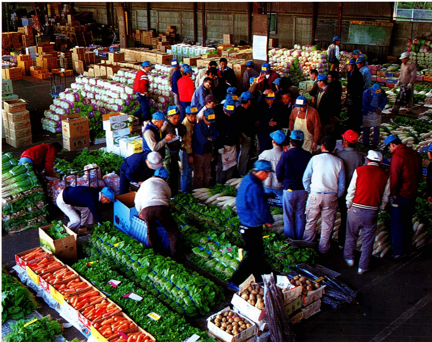
多摩地区の新鮮野菜が一堂に会する福生青果市場