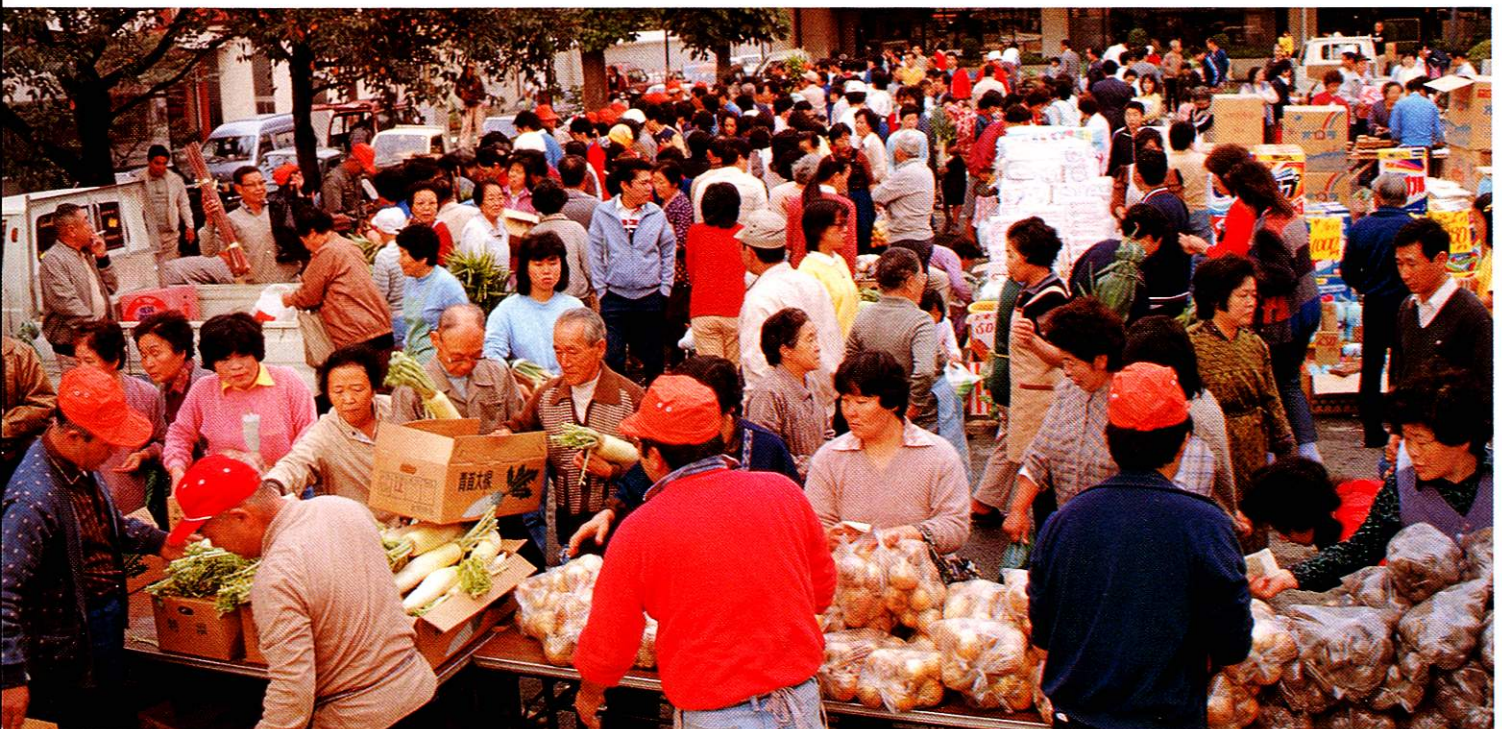
春、秋の人気催事・朝市風景

また春、秋の2回、農家がつくった新鮮な野菜、穀物、果物などを中心に「朝市」が開かれ、市民に大変人気があります。また市では観光農園にも力を入れ、農家との協力で落花生を栽培しています。秋には落花生掘りとり会も開かれ、好評です。