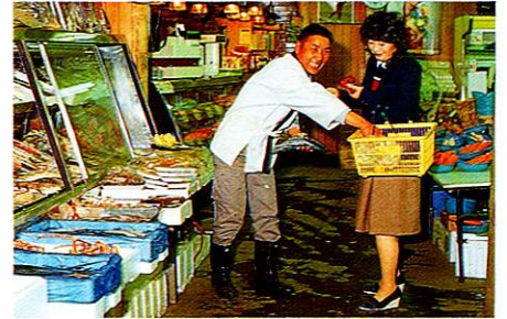
「買物が便利で楽しいまち」と主婦たち

の交通機関を充実させたショッピングゾーンと市民憩いの場を兼ねた商業圏を整備しました。さらに西口の中央商店街をはじめ、各駅前商店街の整備を推進しています。