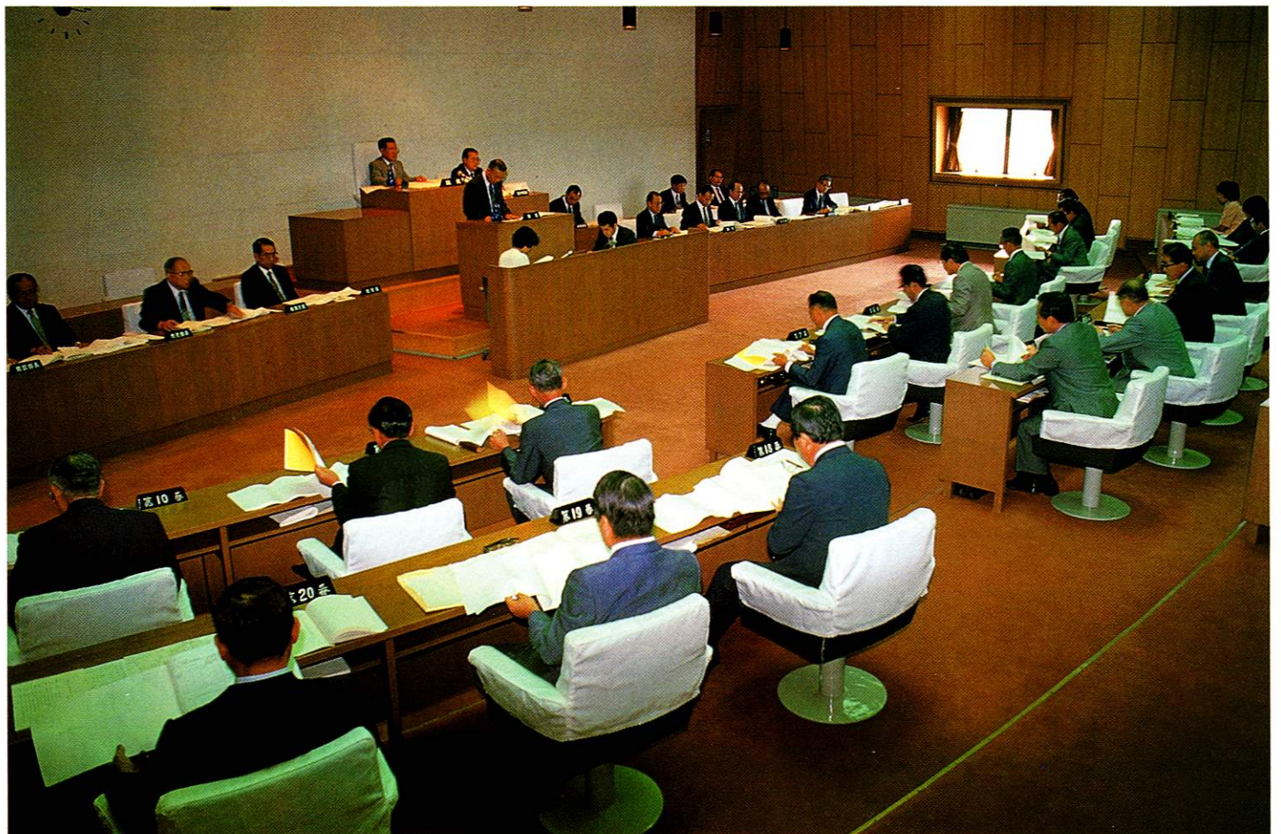
熱心に審議される議会