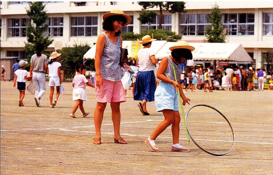
ふるさと遊び (輪まわしと竹馬)