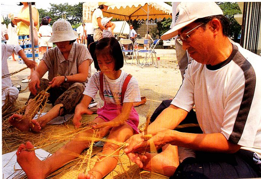
ふるさと遊び (ワラジづくり)