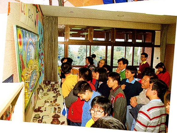
文化祭の作品発表

すべての市民の平等な生活安定を願う本市では、社会的なハンデを背負っている心身障害者でも安心して社会参加できるまちづくりをめざしています。