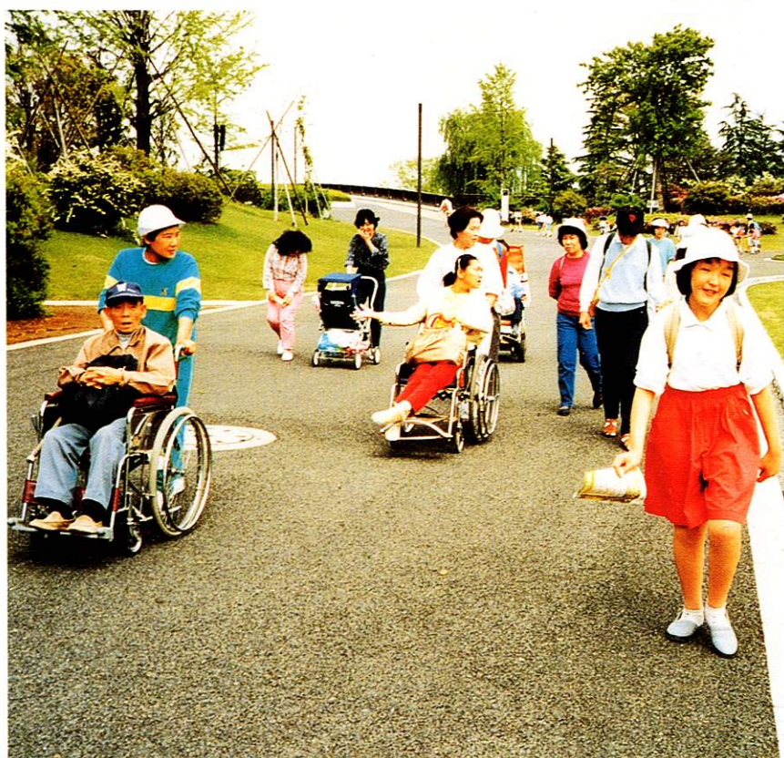
ボランティアの方たちとハイキング

We offer training, and subsidize for obtaining a driver licence, and help them find jobs.