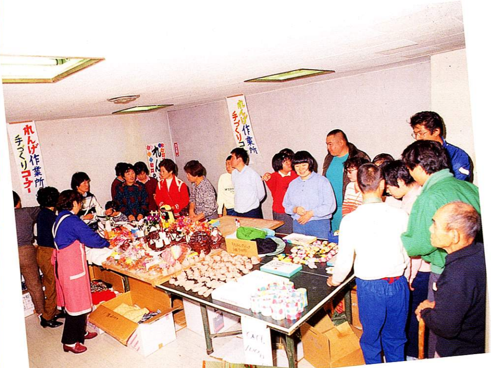
福祉バザーでの即売コーナー