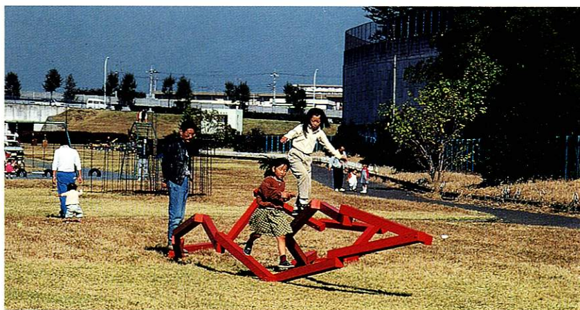
多摩川ふっさ野外美術展

なんか結構小さな子が遊びに来てくれたのですが、最近は多分減っているんじゃないかと思います。子供のためのサークルが少ないように思う。私がマンガクラブに入っていたころは楽しくて、いつも市民会館に自転車で来て、遊んで帰るみたいなこと