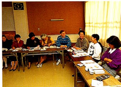
外国人となごやかに学ぶ英会話教室