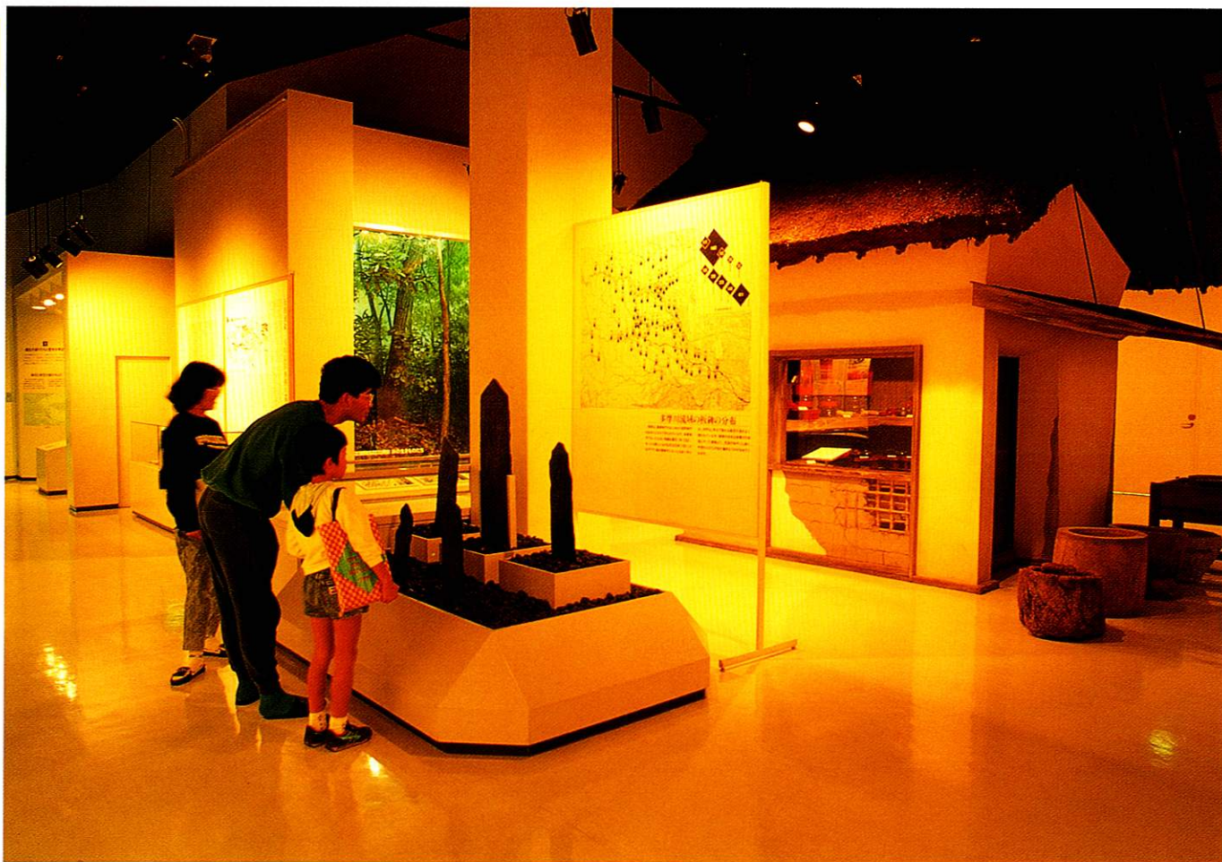
福生市の歴史をわかりやすく展示・紹介している郷土資料室