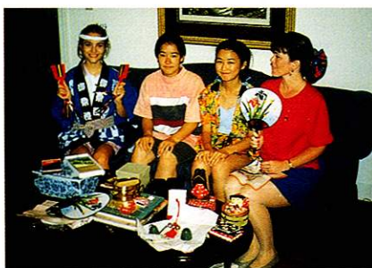
楽しい交流を図るジュニア大使友情使節団