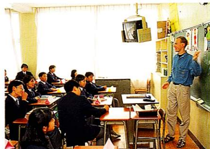
国際化を先取りする外国人講師英語授業