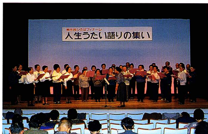
心をひとつにして「人生うたい語りの集い」