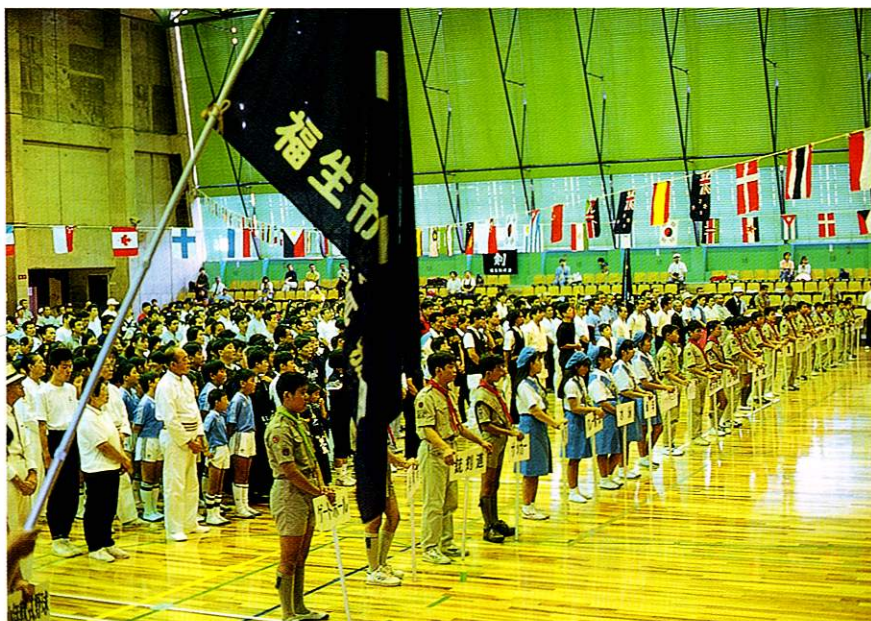
市民スポーツ最大のイベント「市民総合体育大会」