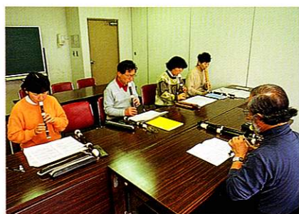
余暇を充実させる市民サークル活動