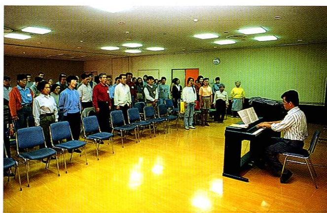
「春の第九」演奏会の練習風景