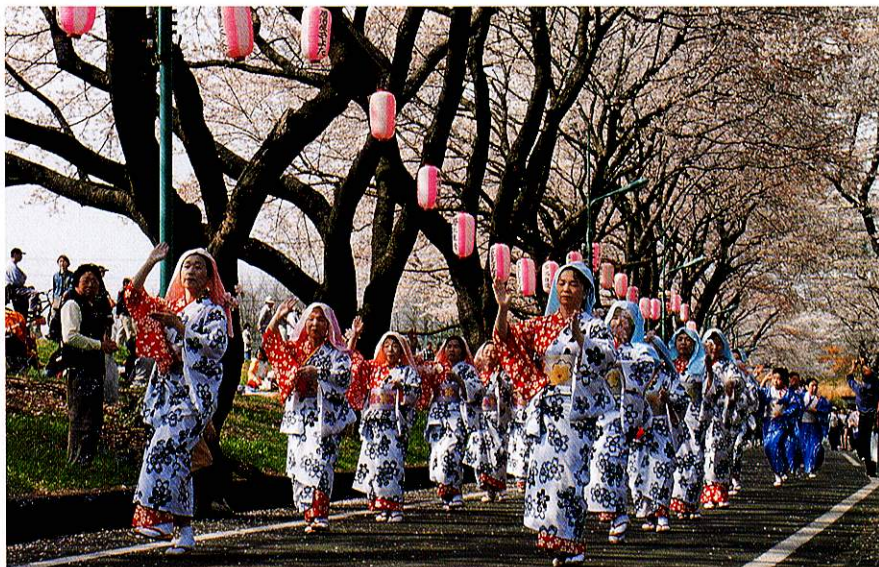
3月 桜まつり Cherry Blossom Festival

自然活動を通して、子どもが安全に楽しく川に親しめるよう、水辺の楽校の活動に取り組んでいます。