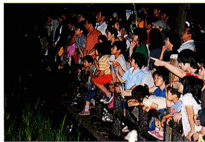
6月 ほたる祭 Hotaru Festival (Firefly Festival)

いにしへの文化と伝統を大切に守る行事。 お年寄りから子どもまで市民がつどえる行事。 自然と環境を大切にして明日の福生を考える行事。 様々な行事に、様々な人が出会い、 人と人とのつながりの輪を創っていきます。