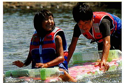
8月 水辺の楽校 Waterside school

湧き水を利用して地元のほたる研究会が育てたほたるたちが、夏の夜を幻想的に彩ります。