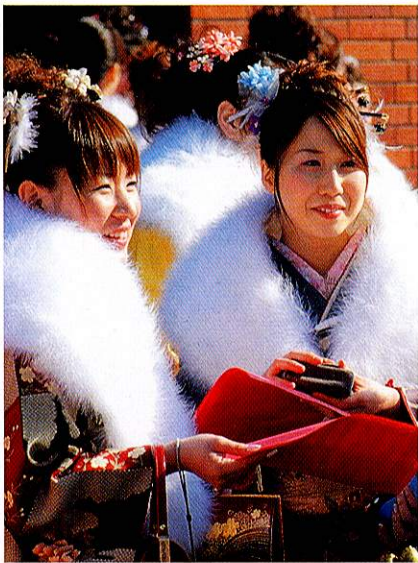
1月 市民会館での成人式 Coming-of-age ceremony