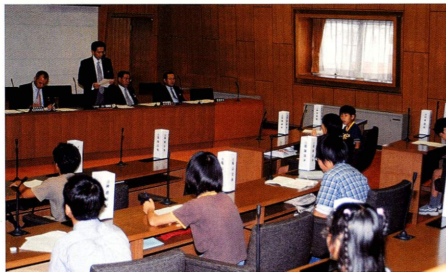
第1回子ども議会 平成13年

市制施行30周年以降、市の行政がもっとも変化してきたのは、市民と行政との関わりにおいてではないでしょうか。サービスを提供する側と受ける側といった図式から、市民が関わり、自らも市を支える一人として、参画し、協働しながら何かをつくりあげるといったことがさまざまな場面で見られるようになりました。