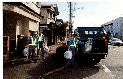
ごみ有料化(個別収集) 平成14年