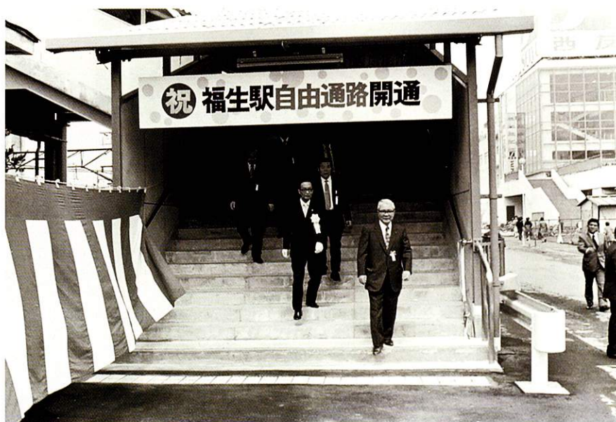
福生駅橋上駅舎・自由橋竣工式典