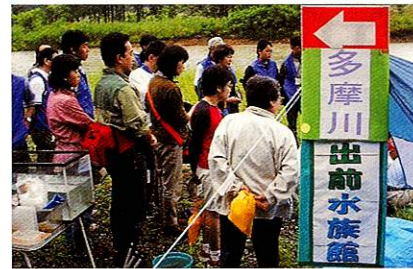
第1回ふっさ環境フェスティバル 平成15年