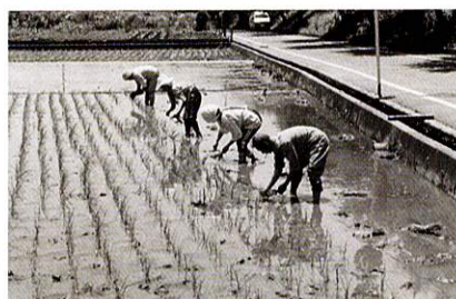
田植えの風景(北田園) 昭和57年