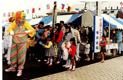
第1回インポートフェア イン 福生 平成元年