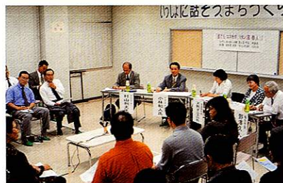
「いっしょに話そう、まちづくりフォーラム」 平成13年