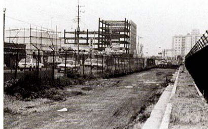
国道16号線拡幅工事 昭和60年