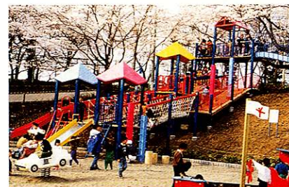
改装オープンした福生公園 平成5年