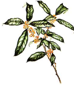
市の木：モクセイ 画：佐藤文字氏