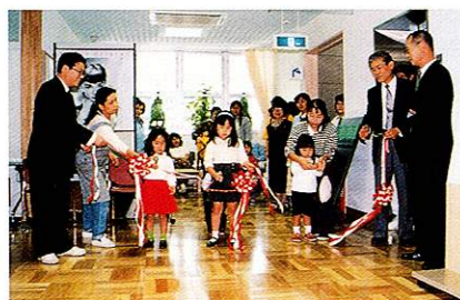
武蔵野台図書館オープン 平成8年