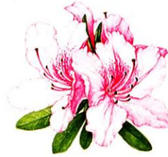
市の花：つつじ 画：井上ナオミ氏