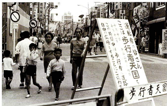
歩行者天国 昭和45年