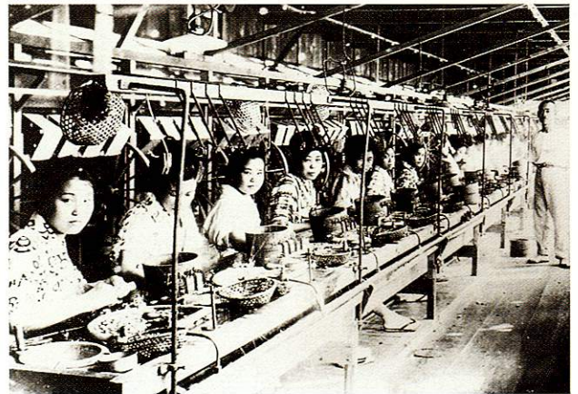
森田製糸所の糸繰り作業 熊川(森田製糸所) 大正14年8月

昭和14年、市の東北部に日本陸軍航空審査部と整備学校が設置され、人口が増加し、翌昭和15年に福生村、熊川村が合併して福生町となりました。戦後は米軍横田基地を中心に急速な発展を遂げ、商店街は急速に大きくなりましたが、昭和37年頃か