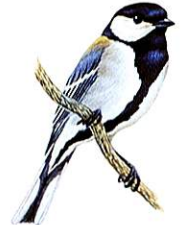
市の鳥：シジュウカラ 画：藪内正幸氏