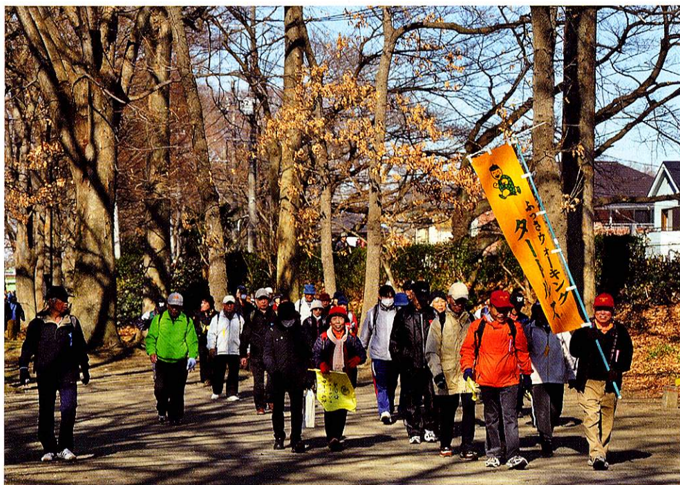
新春ウォーキング