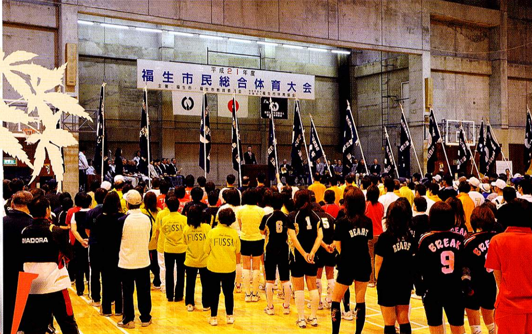
福生市民総合体育大会開会式