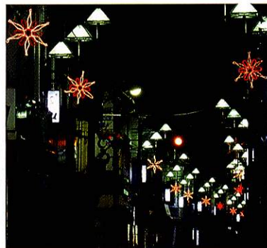
X'mas イルミネーション