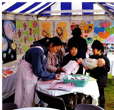
福生ふれあいフェスティバル