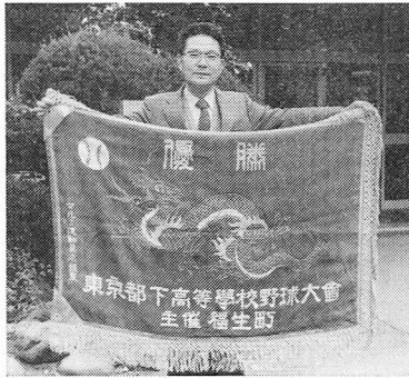
青竜旗 (国立高校保存)

つけても、歳月の流れを感じる今日この頃である。参考までにこの試合のメンバーを紹介すると右のとおりである。 (東京読売巨人軍資料室提供) なお、この時の福生野球場と試合の様子