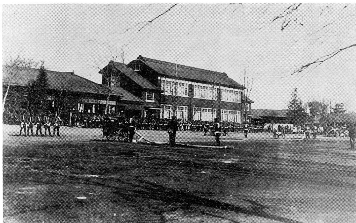
昭和初期の第一小学校（高崎弥太郎氏所蔵）

を右に曲ると応接室兼校長室。そこには招待リレーでいただいた優勝旗があり、子どもの目には印象的に写りました。隣は職員室、先生方が机を並べて仕事をしています。