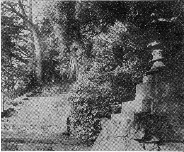
奉納された灯籠（絵はがき）

物の寄進者の名前が銘記されていた。近在の町村はもとより遠くは大阪、三重の津、外国ではシンガポール、また祈願者にいたっては満洲国（現中国東北部）や北海道をはじめ津々浦々の人たちの名前が散見でき、当時の今熊山への信仰のあつさを物語っているものであった。