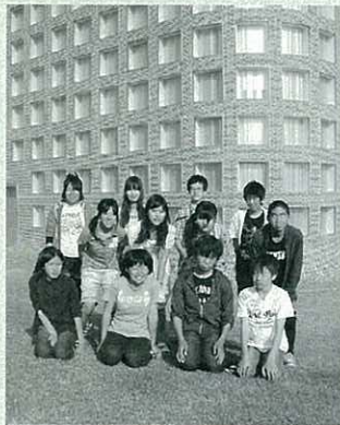
元気に行ってきます!