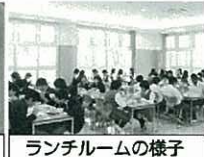
ランチルームの様子

いる食材料についての説明も掲載しています。 福生市公式ページでも中学校のランチルームの紹介をしています。是非、ご覧ください。