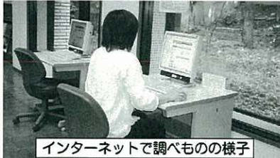
インターネットで調べもの様子

みなさんが図書館で調べ物をする時、ご自身で書架にある図書資料で調べるか、または図書館の職員に問い合わせることがほとんどだと思います。