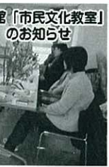
公民館「市民文化教室」のお知らせ

公民館は、講習会、講演会、展示会等の開催、各種の団体、機関等の連絡と支援、また、施設の提供などの事業を実施しています。