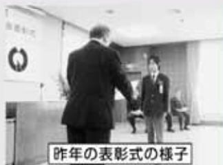
昨年の表彰式の様子

福生市教育委員会では、教育、学術、技術、体育及び文化等に関して功績が顕著である児童・生徒、学校教職員並びに個人及び団体を表彰します。公的機関(国・都等)主催の作文コンクールに応募して受賞した等、表彰基準に該当する方の推薦をお願いします。白薦・他薦は問いません。表彰被表彰者については、表彰