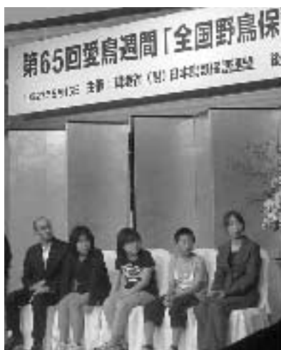
受賞した福生第五小学校の児童たち

2011年3月11日、日本は東北地方太平洋沖地震に見舞われました。多くの人々が地震や津波の被害に遭い、わたしたちも自然の怖さを思い知らされました。自然は、人間の力ではどうすることもできない大きな力をもっています。一方で自然は、わたしたちにたくさんの恵みや豊かさをもたらしてくれています。 福生第五小学校は、西に御嶽（みたけ）や大嶽（おおたけ）を望み、近くには多摩川が流れる、自然豊かなところにあります。学校から歩いて数分の川辺では、アオサギ、カワセミ、キセキレイなどの観察ができます。校庭の巣箱には、シジュウカラやムクドリが毎日遊びに来ています。 福生五小は、いつも近くに鳥のいる、鳥と仲の良い学校です。わたしたちはこれからも、伝統ある愛鳥校のバトンをつないでいきます。野鳥を愛し、野鳥が住む自然を大切に守り続けます。