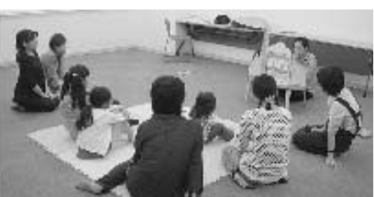
おはなし会の様子