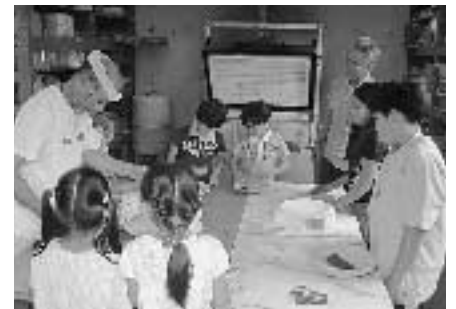
素焼き窯入れの様子