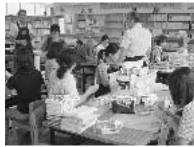
図書の整理の様子