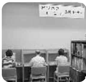
ビジネス・しごと支援コーナーの様子