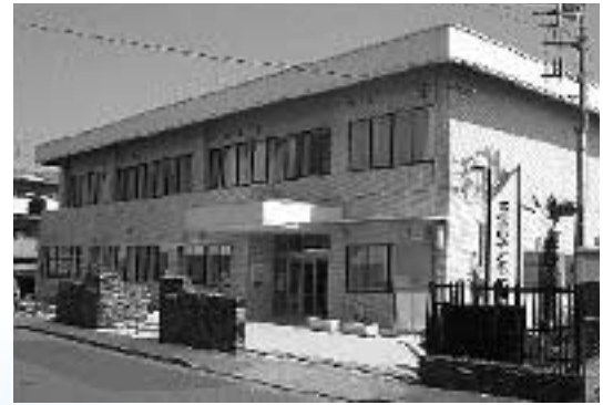
福生市子ども応援館（福生市北田園2-5-7）2階に教育相談室、学校適応支援室があります

教育相談室、学校適応支援室（そよかせ教室）、公立小中学校教職員研究・研修所の3つの機能で福生の教育を支えます