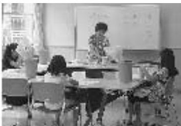
生け花・スケッチ教室

準備にも多くの時間を費やし、日頃の生涯学習の成果を子ども教室で存分に発揮していただきました。その中で「写真で見える福生の歴史教室」は、武蔵野台クラブ(学童クラブ)の子どもたちや、高齢者の話を聞き加えたいという多くの参加がありました。