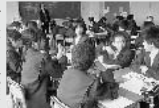
スプリングスクールの様子

中学1年生を対象に、宿泊学習教室(スプリングスクール)(375万円)を実施しています。入学後、学習習慣、生活習慣の改善にみんな頑張っており取り組みました。