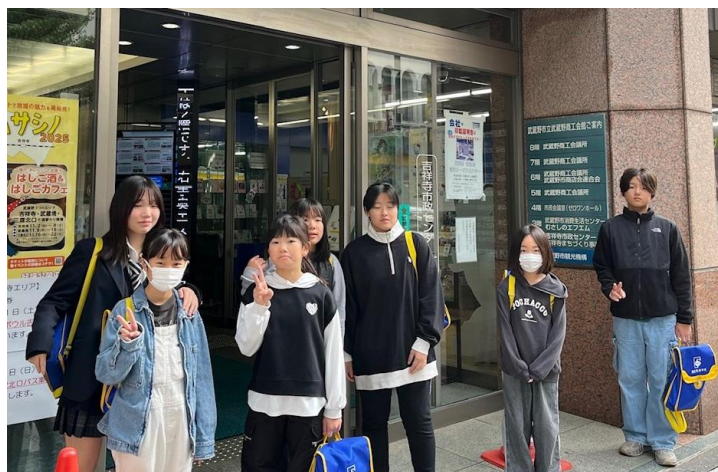
写真は第五ブロック珠算競技大会当校選手

12月はクリスマスと冬休みがあります。 11月のMLBワールドシリーズはドジャースが優勝。大相撲九州場所でウクライナ出身の安青錦初優勝で大関昇進。大分で大規模火災。熊本県阿蘇地方で震度5強。全国でクマ被害。インフルエンザ流行で熱せん妄に要注意。香港マンション火災。