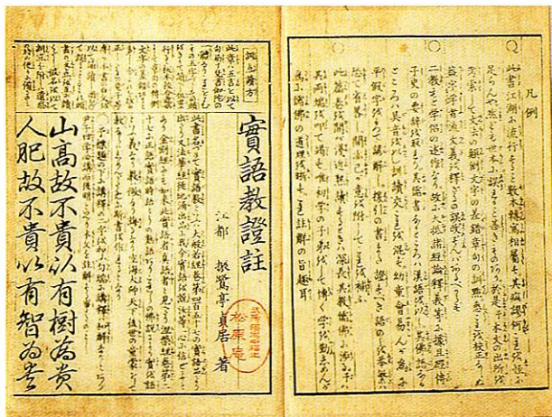
15 実語教童子教証註 じつごきょうどうじきょうしゅうちゅう 一冊 大本 文化13 (1816) 序 勝村治右衛門・河内屋喜兵衛 他8肆

『実語教』は平安時代末期の成立で、『童子教』は鎌倉時代前期の成立と推定されているが、近世になると概ね『実語教』は弘法大師作、『童子教』は安然和尚作とするものが多い。近世ではこの二教はほとんどの場合、合本されている。『実語教』は主に「智」を礼賛し、学問のあらましを初学者に諭す勸学教訓で、『童子教』はこの世の因果の道理や儒仏の教えを諭した幼童訓・処世訓である。両教とも暗誦に便利だったため寺子屋でも盛んに使われたことから、板式の多様性と板種の多さは往来物の中で随一である。