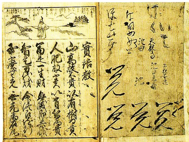
16-1 実語教童子教 じつごきょうどうじきょう 一冊 大本 安政5 (1858) 再版 河内屋太助梓