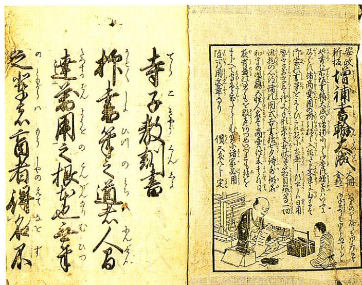
19 寺子教訓書 てらごきょうくんしよ 一冊 半紙本 安永? (1854~1859) 河平板