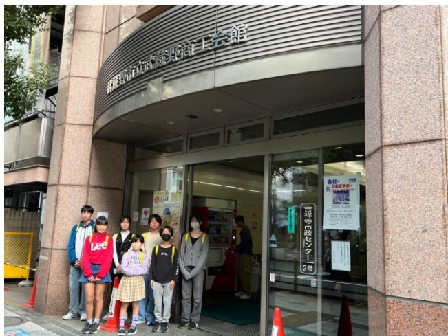
【写真は第五ブロック珠算競技大会会場前】

おかげさまで 300号。12月です。11月はプロ野球日本シリーズ、横浜DeNAが26年ぶり日本一。大谷翔平DHで大リーグ初の満塁MVP。アメリカ大統領選挙トランプ氏勝利。兵庫県知事選挙、斎藤前知事再選。H3ロケット4号機打ち上げ成功。防衛通信衛星「きらめき3号」軌道へ。