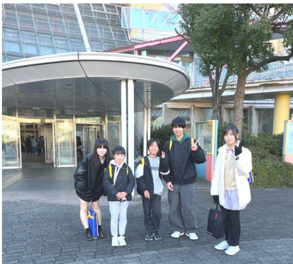
【写真は全東京珠算選手権大会会場前】