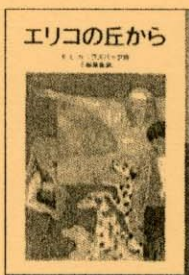
エリコの丘から 図書館に所蔵 しています！ 読んでみてね！